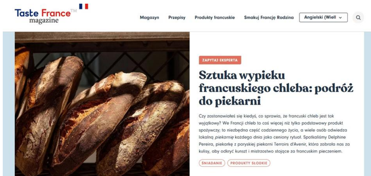
Fot. 3. Witryna internetowa Taste France; www.tastefrance.fr ; data dostępu: 20.06.2025r.

Treści tworzy zespół redaktorów, bloggerzy kulinarni, szefowie kuchni, cukiernicy, styliści kulinarni.