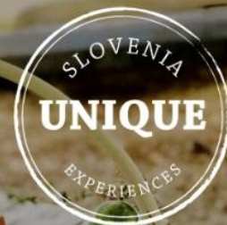
Fot. 2 Witryna internetowa I feel Slovenia; https://www.slovenia.info ; data dostępu: 20.06.2025r.

Taste Slovenia odgrywa kluczową rolę w przyciąganiu turystów zainteresowanych autentycznymi doświadczeniami kulinarnymi. Poprzez promocję lokalnych smaków, zrównoważonych praktyk i wysokiej jakości usług gastronomicznych, projekt przyczynia się do wzrostu atrakcyjności Słowenii jako destynacji turystycznej. Współpraca z międzynarodowymi przewodnikami, takimi jak Michelin i Gault & Millau, oraz organizacja wydarzeń kulinarnych podnoszą prestiż słoweńskiej kuchni na świecie.